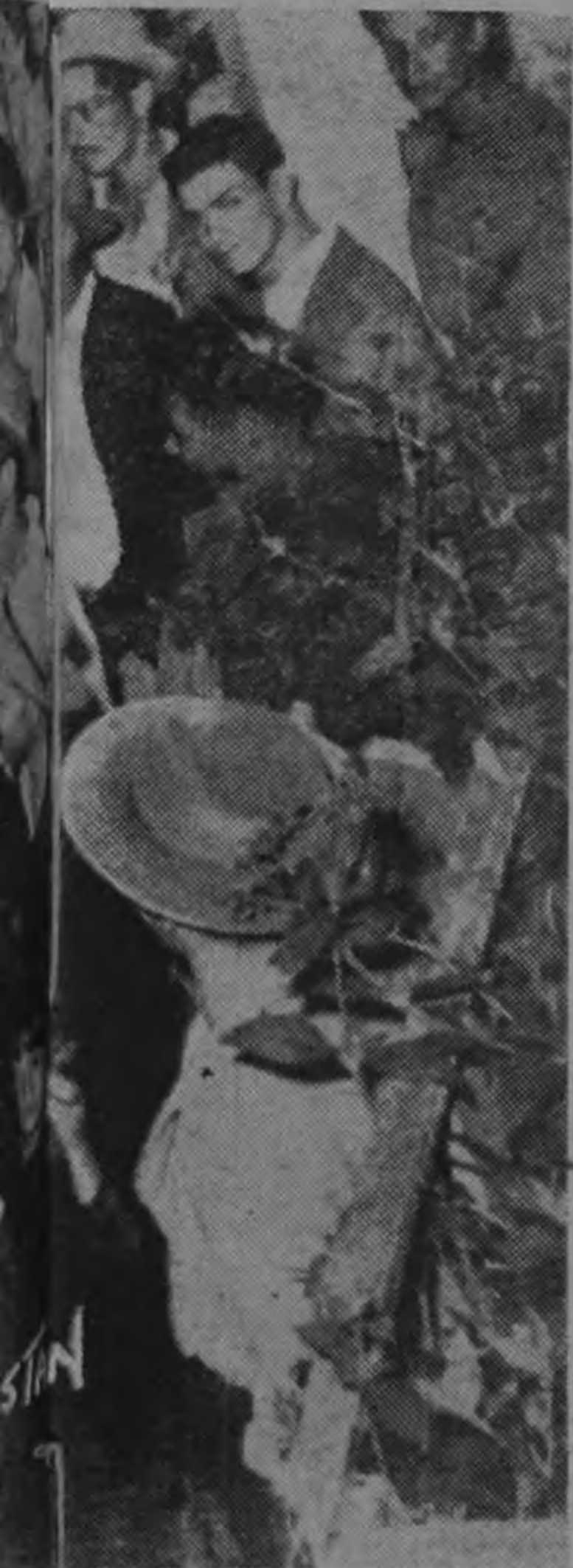
se reunió para escuchar la

educación. Manifestó que la cultura no debe ser un monopolio de privilegiados, para darle verdadero sentido a la democracia. Recordó que la Junta de Gobierno había declarado gratuita la segunda enseñanza, pero que esto no bastaba aún. Enfocó también la necesidad de la enseñanza vocacional y la necesidad de construir colegios de segunda enseñanza, pero para todo esto, continuó diciéndonos D. Pepe, necesitamos vitalizar la economía del país produciendo más. Se refirió también el señor Figueres a otros tópicos tales como la campaña de farsa y de calumnia del mariachismo, mientras nosotros estamos empeñados en una campaña de altura, de gran civismo patrio, y nuestros enemigos al tratar de engañar a los demás, lo que están haciendo es engañarse a sí mismos. Aludió también don Pepe a la necesidad de ser honrados en las declaraciones del impuesto sobre la Renta, para así poderles exigir honradez a sus gobernantes.