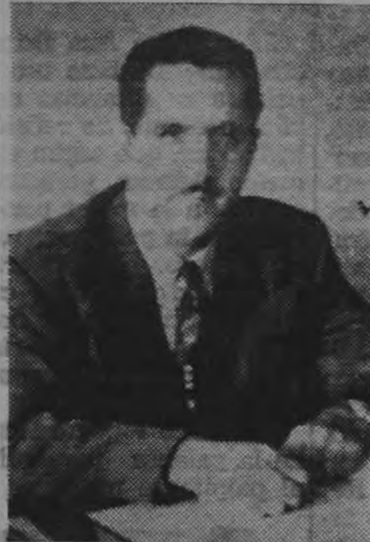
LIC. DON ELADIO TREJOS F.

Se trata, señores diputados, de suprimir una disposición absurda y antidemocrática de nuestra Carta Magna. Es ilógico castigar a un ciudadano y menoscabarlo en sus derechos, por la sola razón de haber sido un buen Presidente. Porque de los malos Presidentes, el pueblo se encarga de atajarlo en sus pretensiones de aspirar a un nuevo periodo de mando. Esa disposición, por consiguiente, solamente habrá de servir para que el país se prive de los beneficios que se derivan de un buen gobernante, con menoscabo, también, del principio democrático de la libre elección. La disposición que se trata de variar, es contraria, además, al sentimiento y a la tra-