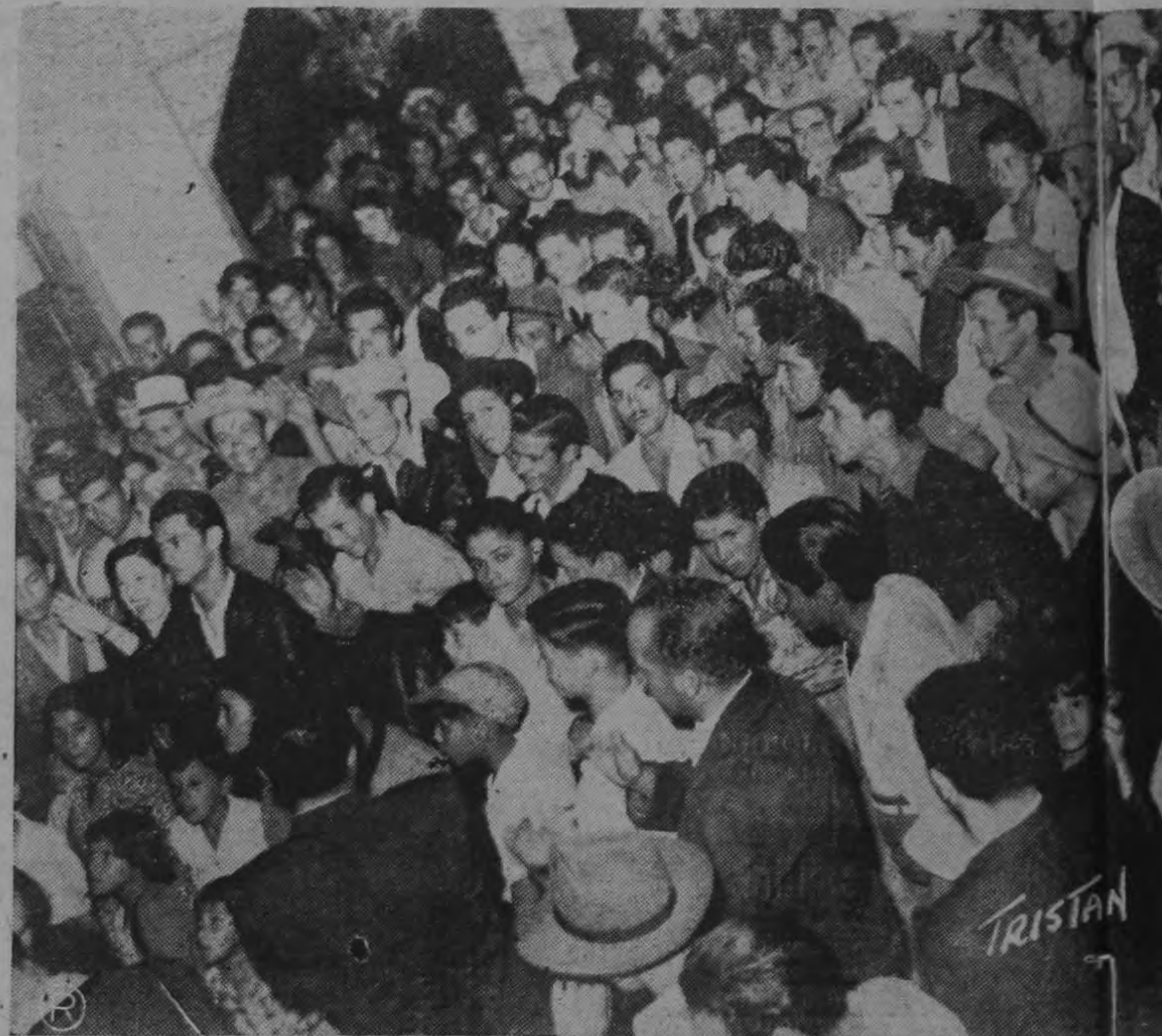
Gráfica que muestra un aspecto de la concurrencia que antenoche se reunió en la Conferencia del Sr. Figueres.