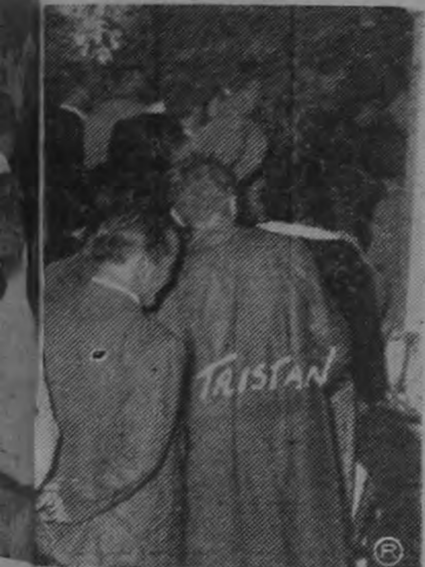
que a pesar de la lluvia, se con- vareteará a saludar al caudillo